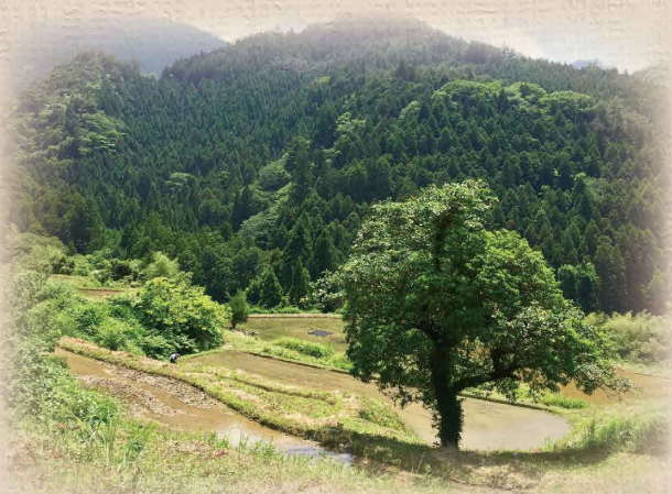
土佐町石原地区の棚田風景