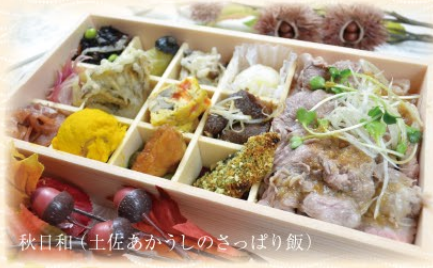
秋日和 (土佐あかうしのさっぱり飯)

土佐あかうしの和風ソース和え、 秋刀魚の香草パン粉焼き、四万十鶏の桑焼き、 舞茸の天婦羅、エリンギとトマトのスパニッシュオムレツ、 生ハム、小茄子のお浸し、五目ひじき、キノコのみぞれ和え、 南瓜サラダ、茗荷のピクルス、栗さんどん大福