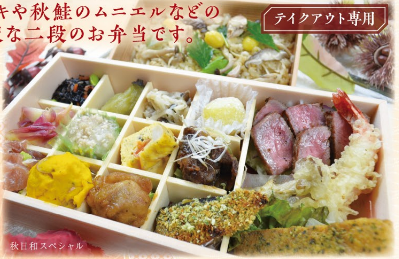
秋日和スペシャル

土佐あかうしの和風ソース和え、 秋刀魚の香草パン粉焼き、四万十鶏の桑焼き、 里芋のそぼろ餡かけ、エリンギとトマトのスパニッシュオムレツ、 生ハム、小茄子のお浸し、五目ひじき、キノコのみぞれ和え、 南瓜サラダ、茗荷のピクルス、栗さんどん大福