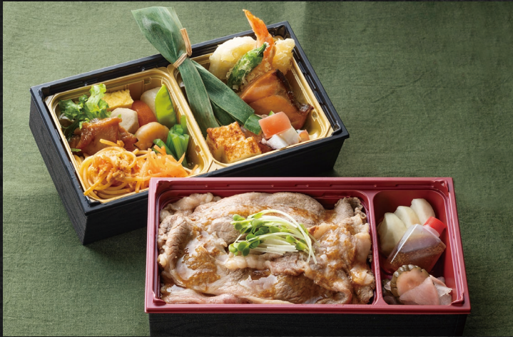
土佐あかうし牛飯二段重 ¥3,000 (税込)

一年のお疲れ様のご褒美に。また新年のお祝いに。親しい方々とお召し上がりくださいませ。