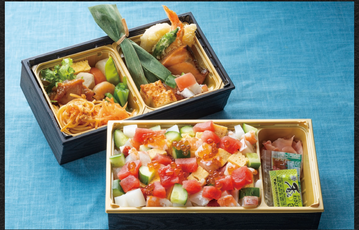
海鮮ちらし寿司二段重 ¥3,500 (税込)

上段 (組盛り合わせ) / 煮物(大根、人参、里芋、海老、絹さや)、人参のラペ、若鶏の照り焼き、鮭の幽庵焼き、鶏とレンコンのミートスパ、出し巻き、かまぼこトーフ、天婦羅(海老、レンコン、しし唐)、小松菜のお浸し、笹葛クリーム、タコときゅうりのサラダ