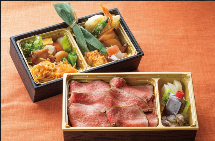
土佐あかうしローストビーフ二段重 ¥4,000 (税込)