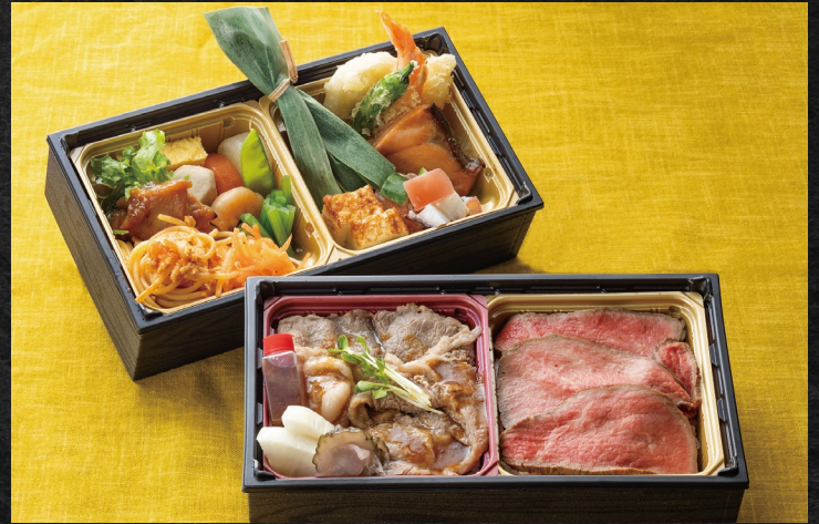
土佐あかうしダブル二段重 ¥3,500 (税込)